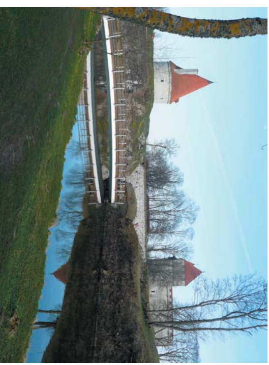
Piispanlinna, eräs Kurusaaren nähtävyyksistä, on aivan hotellimme vieressä.

8.8. sunnuntai. Lähtiö kotimatkalle on aamiaisen jälkeen. Merimatka Tallinna-Helsinki tehdään samalla Star-alkusella kuin mennessä. Kotona Kiteellä arvioidaan oltaavan puolen yön tienoilla.