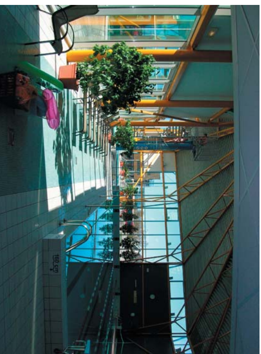
Meri-kylpylän vieressä sijaitsevan Riihtlin Vesimaailma on käytössämme maksutta.

Matkatoimisto tarjoaa bonuksena Havukais-ryhmälle vapaan opastuksen sinne. Sama suomenkielinen puhuva Ameli-opas on mukana saarikertroksella perjantaina. Tämä violenta ovat jo 1.4. Kurusaaren Meripäivät. Nyt tapahtuma on 6 - 8.8., joten sekin osuu sopivasti matkoijelmää täydentämään.