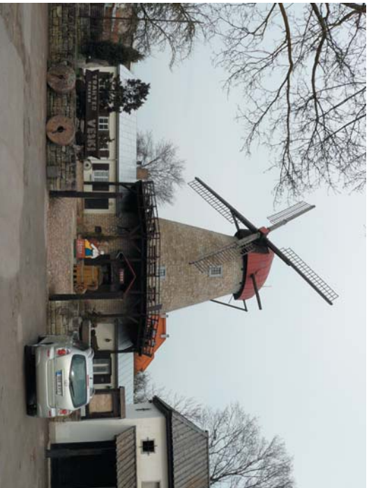
Kurusaari on viehättävä pikkukaupunki meren hengessä.